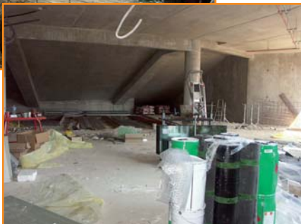
Une partie du futur espace de convivialité.