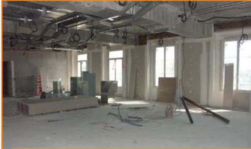
La future salle du Conseil municipal et des mariages.