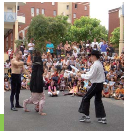
Et la rue s'anime avec les Matatchines !

et bonne humeur cette semaine des Familles et leur donne rendez-vous en 2007 pour de nouvelles aventures... ■