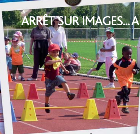
Matusepiades 29 juin 2010