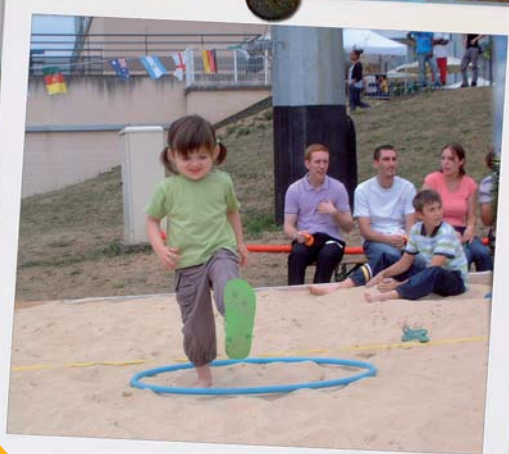
Vauréal Plage du 13 juillet au 19 août 2010