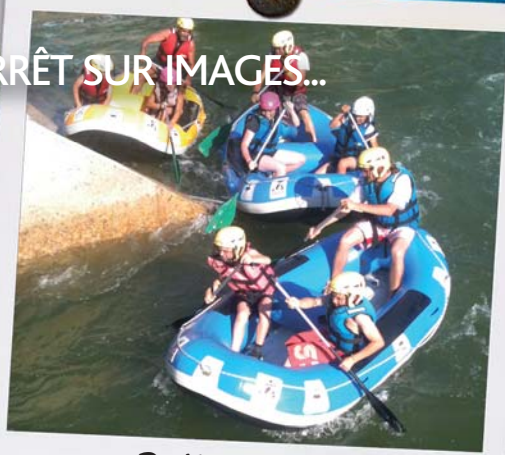
Rallye Raid 12 juillet 2010