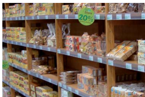
De larges allées et une belle présentation...

dernier, a fait apparaître une majorité de consommateurs (56 %) favorable à l'implantation d'un supermarché classique, mais aussi qu'une forte minorité ne le souhaite pas. Et cerise sur le gâteau, la plupart des "pour" voudrait du très grand ! Difficile dans ces conditions de contenter tout le monde... Biostore représente une solution médiane et complémentaire : elle comble ainsi un manque dans l'offre commerciale de Vauréal et de Cergy-Pontoise. Une récente étude menée par la Communauté d'agglomération (voir notre encadré) a d'ailleurs confirmé cette hypothèse comme étant la plus adaptée au paysage commercial actuel.