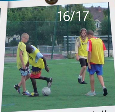
Tournoi de Football 13 juillet 2010